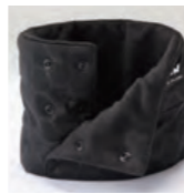
前開き調整ボタン