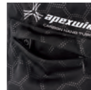
バッテリーポケット